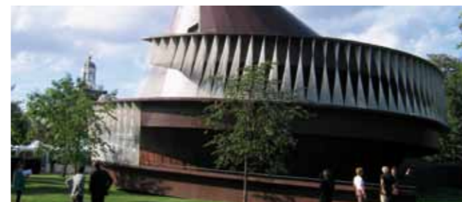
Serpentine Gallery Pavilion 2007, Londra (UK)