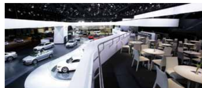
Stand fieristico VW, Salone dell'automobile Ginevra 2009, Ginevra (CH)