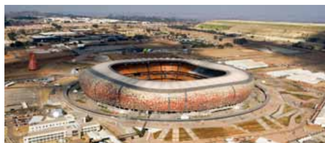
Soccer City, Campionato Mondiale di Calcio FIFA 2010, Johannesburg (ZA)