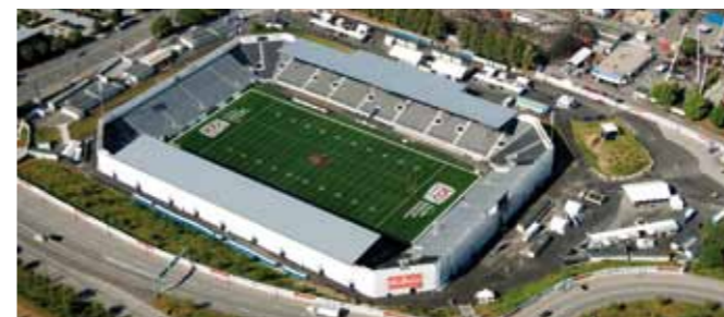
Empire Field Stadion 2010, Vancouver (CA)

La pianificazione e l'allestimento di tribune e palchi costituiscono una delle nostre competenze di base. Grazie alla loro modularità e adattabilità, i nostri sistemi di tribune e palchi trovano le più svariate applicazioni. I sistemi sviluppati internamente sono il risultato di un'esperienza decennale e di un'ottima competenza nelle soluzioni di costruzioni per eventi.