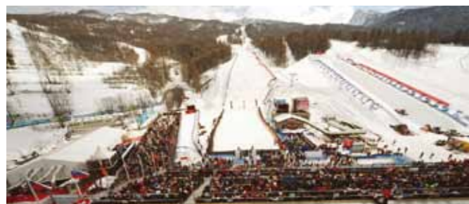
Giochi Olimpici Invernali 2006, Torino (IT)