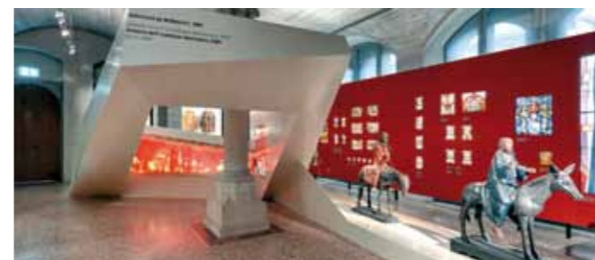
Esposizione "Storia della Svizzera", Museo nazionale, Zurigo (CH)